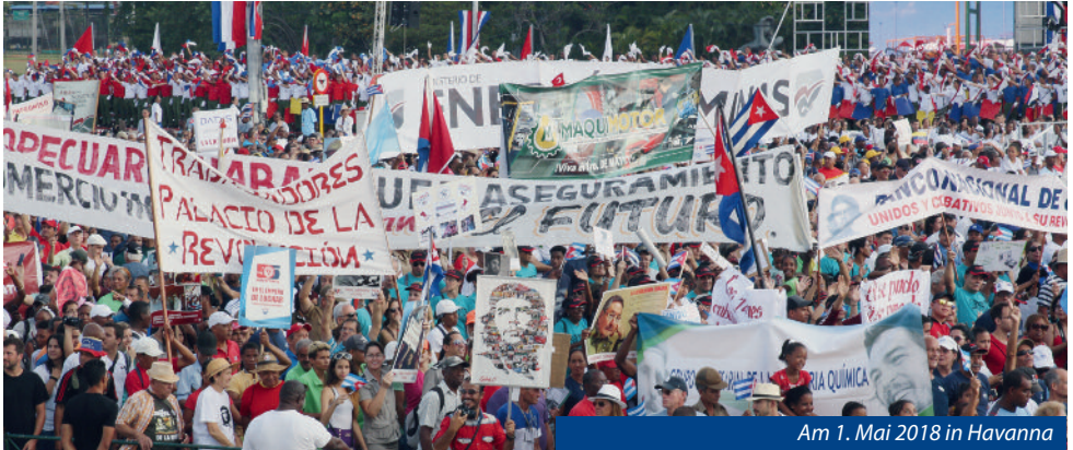
Am 1. Mai 2018 in Havanna

Aktuelle Eindrücke und Einschätzungen aus Kuba