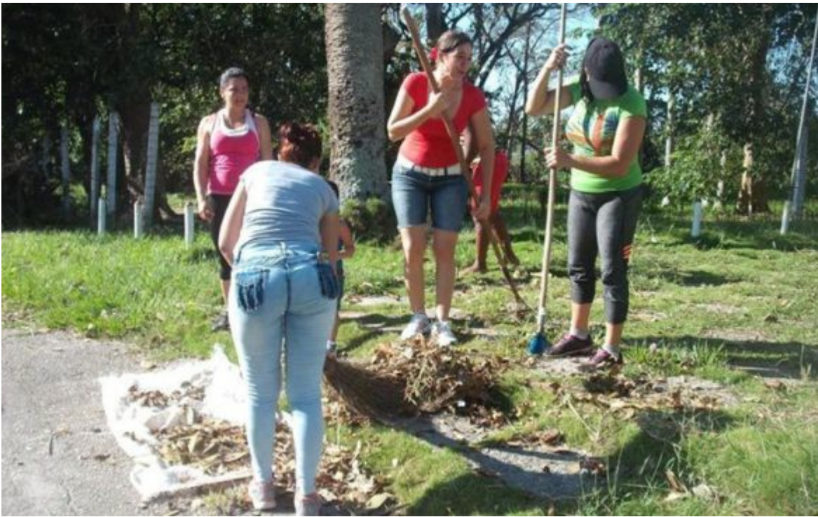
Aufräumarbeiten nach „Irma“ auf Kuba